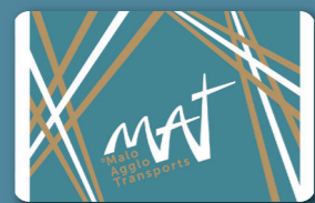
Billet sans contact